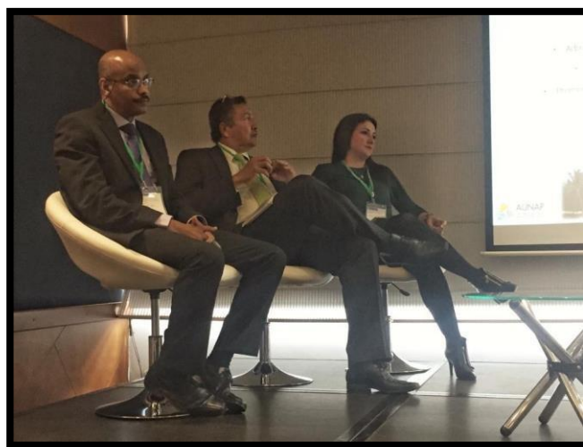
Foto 3. Directores de las áreas misionales de la Aunap dando respuesta a inquietudes del auditorio

Cada uno de los coordinadores de los diferentes procesos, direcciones técnicas y oficina de generación del conocimiento y de la información de la Aunap , dio cuenta de las acciones y resultados, así como los presupuestos comprometidos, durante la vigencia 2017 y 2018, Corte 31 de octubre.