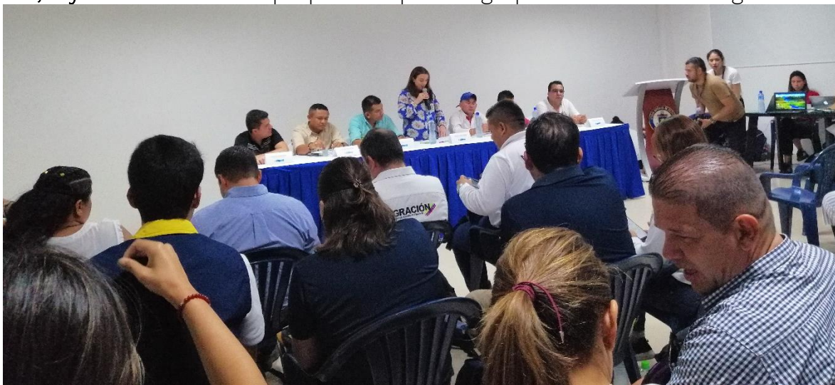
Foto 4. Mesa de alcaldes