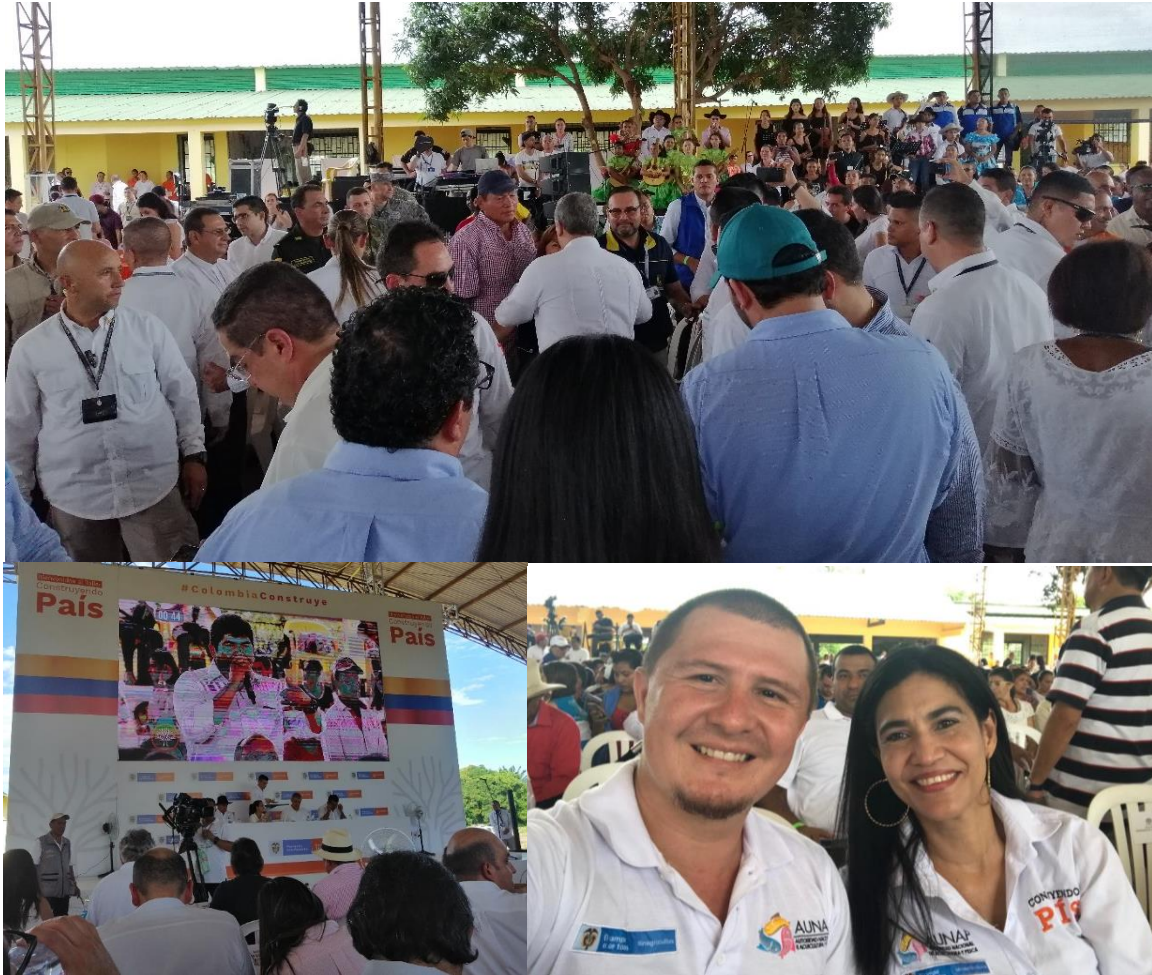
Foto 5, 6 y 7. Taller construyendo país