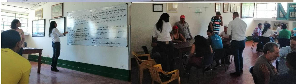
Foto 1, 2 y 3. Problemáticas propuestas por los grupos de la mesa de agricultura